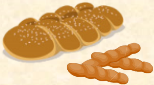
Τσουρέκια και κουλουράκια

Τι έφτιαχναν οι νοικοκυρές για την Κυριακή του Πάσχα;