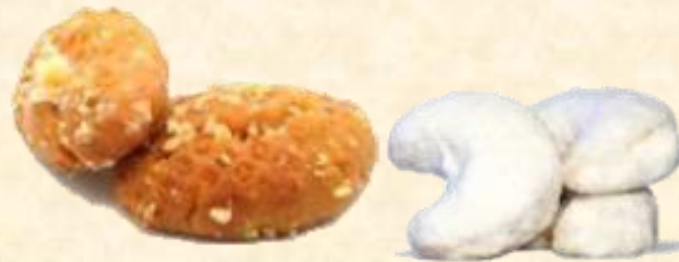
Μελομακάρονα και κουραμπιέδες